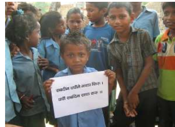
जकर घरमे चर्पी नै, ओकर घरमे शादी नै ।